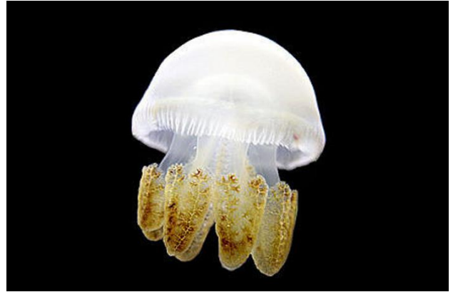
Breede jellyfish

Lorsque certains animaux abyssaux, comme des méduses par exemple, sont en présence de prédateurs, ils se servent de la bioluminescence pour leur échapper.