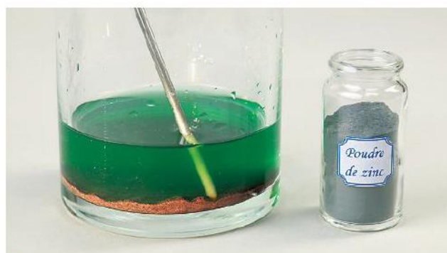
D On observe le contenu du cristalliseur.