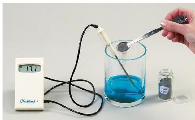
B On verse de la poudre de zinc dans la solution.