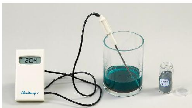
C On agite et quelques minutes plus tard on relève à nouveau la température. Une évolution de température indique l'apparition ou la disparition d'énergie thermique.