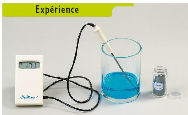
A On relève la température d'une solution de sulfate de cuivre contenue dans un cristalliseur.

On reproduit la transformation chimique qui a lieu en versant de la poudre de zinc dans une solution de sulfate de cuivre (cf. les photos d'expérience ci-dessous).